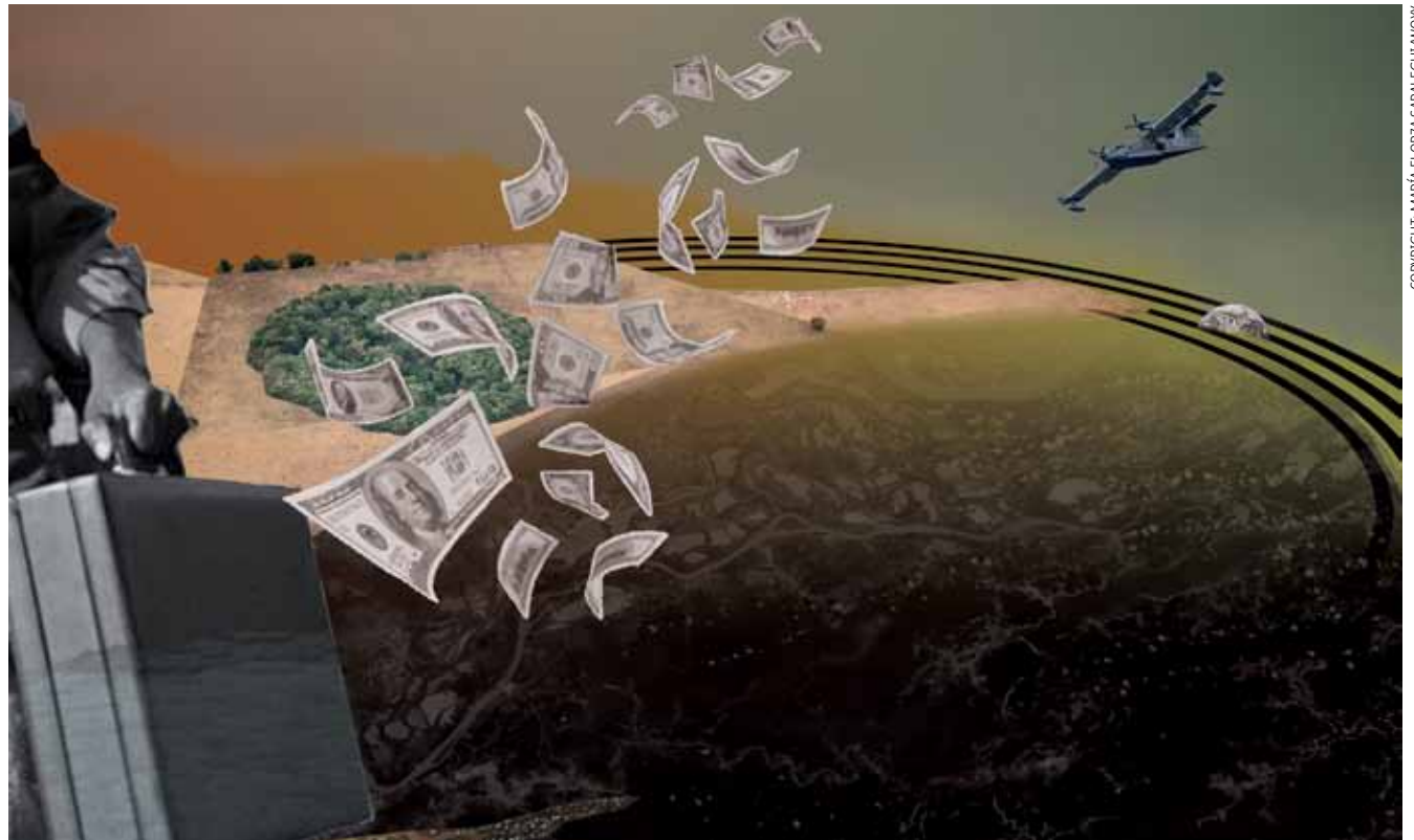
Fünfzehn Jahre sind seit der COP15 in Kopenhagen vergangen, auf der sich Staaten erstmals auf eine Summe zur Klimafinanzierung einigten. Seitdem hat sich der Luxemburger Beitrag nur langsam erhöht.

Dass die Regierung Investitionen, die nicht direkt zur Anpassung ans Klima oder dessen Schutz beitragen, gegenüber der UNFCCC als internationale Klimafinanzierung deklarieren darf, liegt daran, dass es keine einheitliche Definition gibt: Was unter Klimafinan-