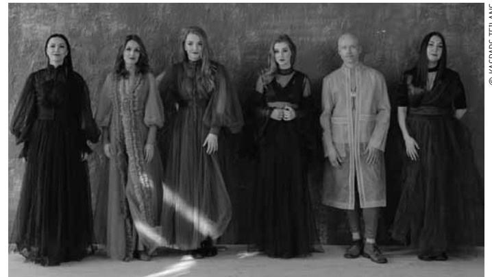
Le chœur Latvian Voices se produira ce dimanche 1er février à 11 h à la vieille église St. Laurent à Diekirch dans le cadre du festival A Cape'Ila.