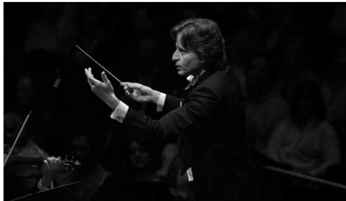
Le Toronto Symphony Orchestra, dirigé par Gustavo Gimeno, se produira le lundi 2 février à 19 h 30 à la Philharmonie.