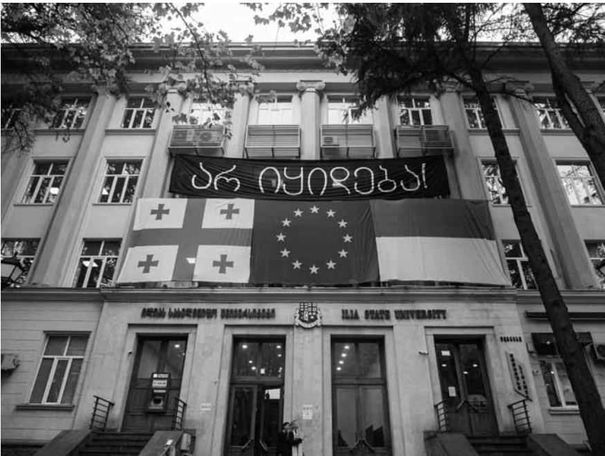
„Unsere Uni steht nicht zum Verkauf!“. Banner am Hauptgebäude der Ilia-Universität im Zentrum von Tiflis.

Dabei ist Georgien seit Dezember 2023 offiziell EU-Beitrittskandidat. Dennoch hat sich die Regierung in den vergangenen Jahren politisch russischen Positionen angenähert. So wird durch ein Mitte 2024 verabschiedetes Gesetz zur „Transparenz“ bei „ausländischer Einflussnahme“ die Arbeit unabhängiger Nichtregierungsorganisationen