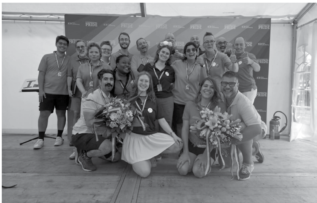
Anlässlich des Pride Month geben der Queer Choir Luxembourg und die Luxemburger A-cappella-Gruppe Sultry am Samstag, dem 27. Juni, um 19 Uhr ein Konzert im Centre culturel de Neudorf.