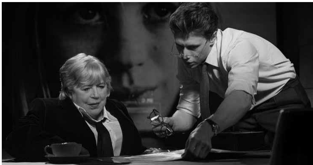
„Broken English“ erzählt das Leben der Sängerin und Schauspielerin Marianne Faithfull nach, die sich über Jahrzehnte hinweg immer wieder neu erfand. Neu im Utopia.